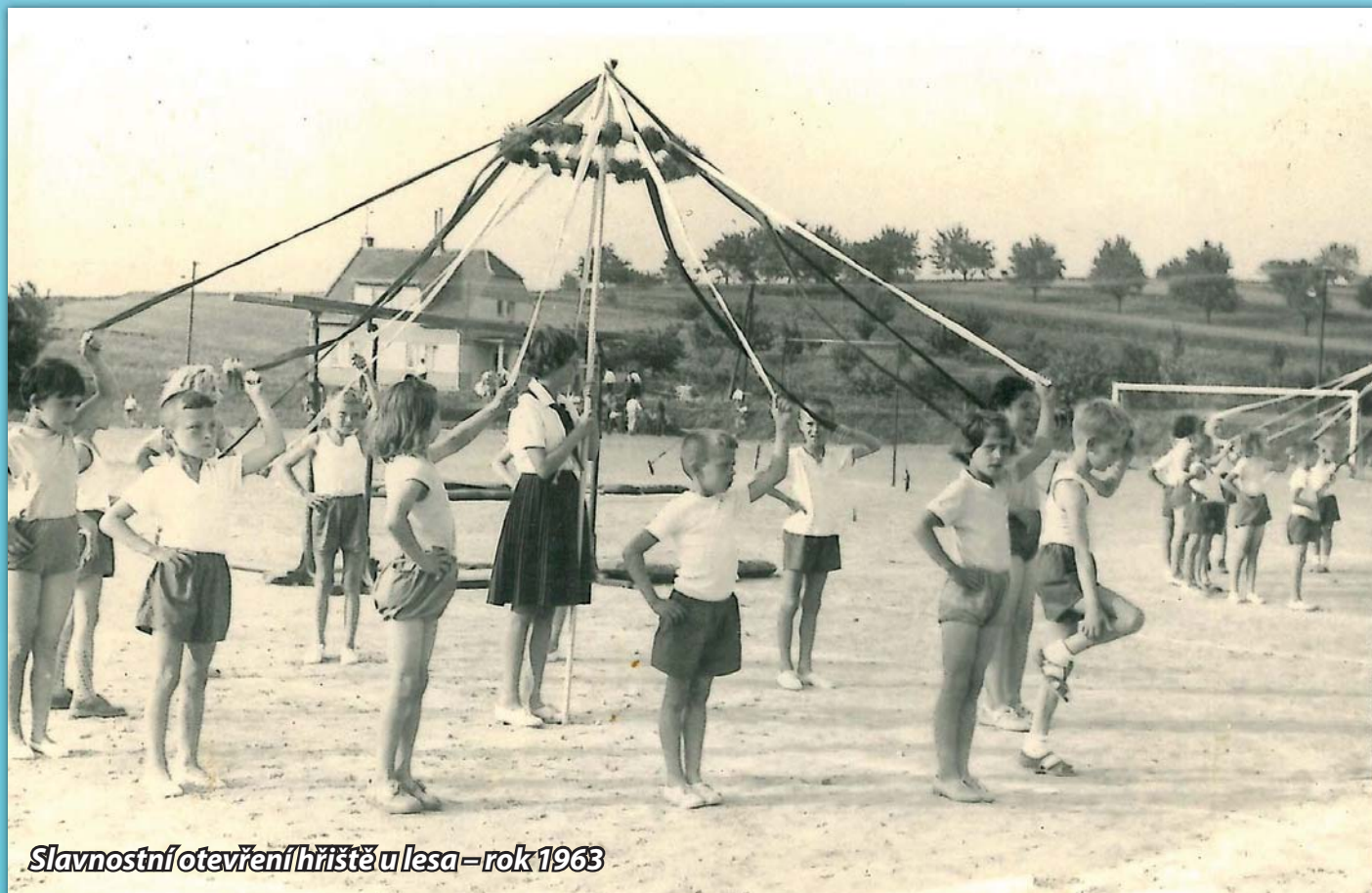
Slavnostní otevření hřiště u lesa – rok 1963