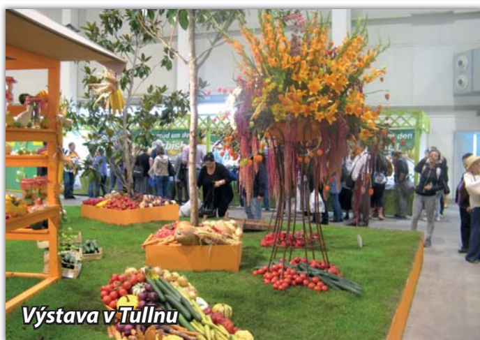
Výstava v Tullnu