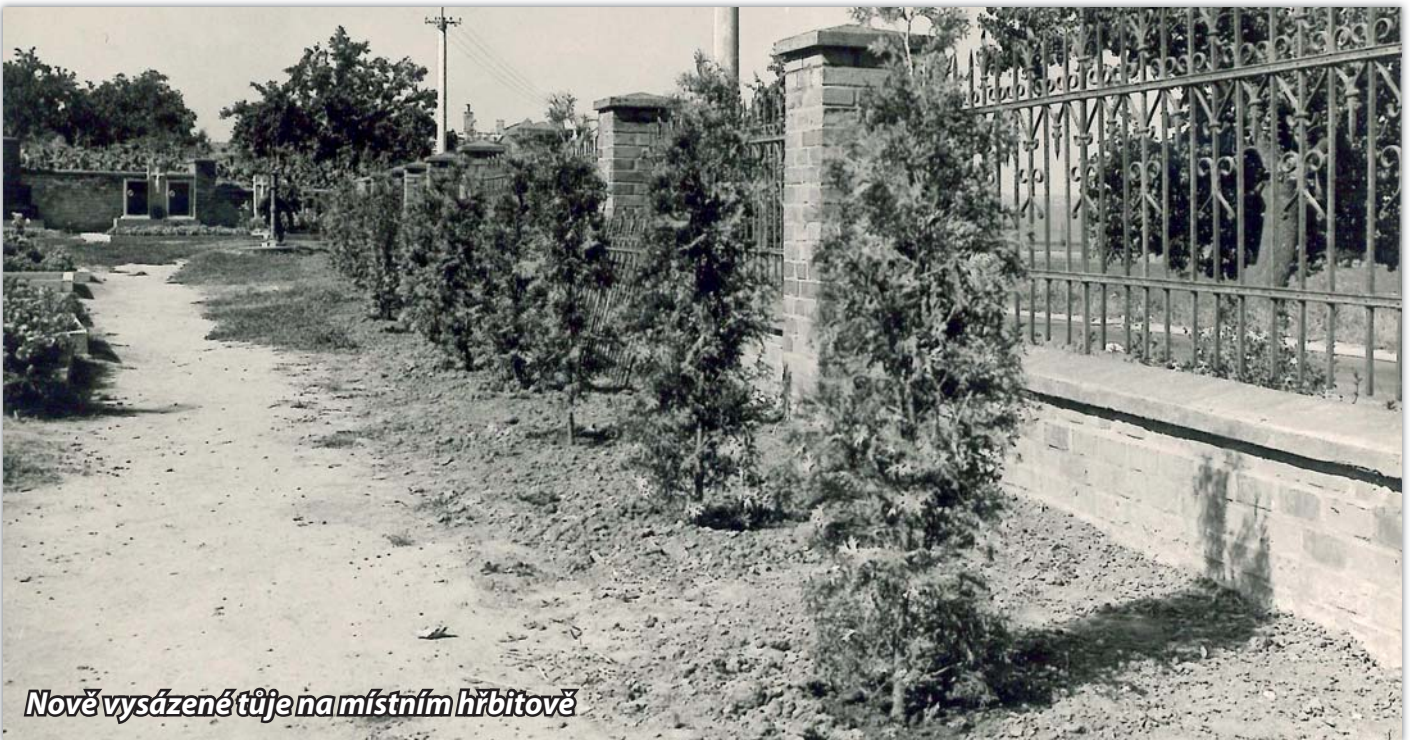
Nově vysázené tůje namístním hřbitově