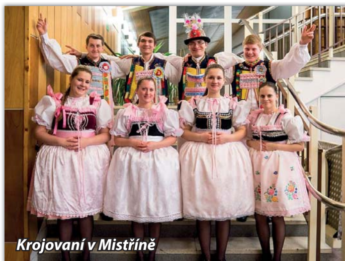
Krojovaní v Mistříně