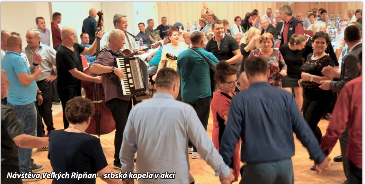
Návštěva Velkých Ripňan – srbská kapela v akci