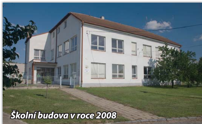
Školní budova v roce 2008