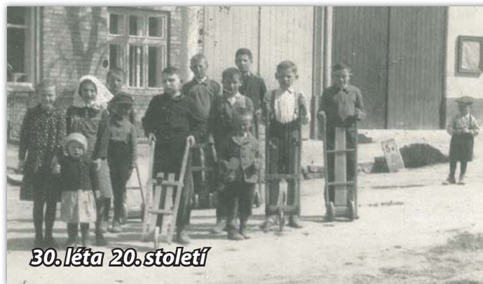
30. léta 20. století