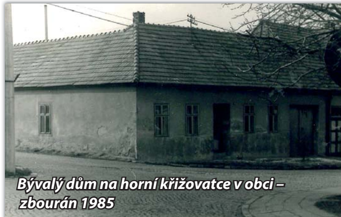
Bývalý dům na horní křižovatce v obci – zbourán 1985