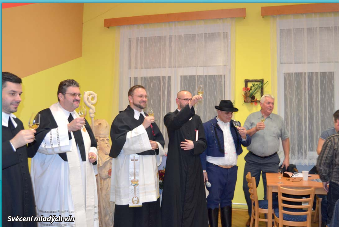
Svěcení mladých vín

Vydala obec Želetice v lednu 2018, tel: 518 622 725, e-mail: zeletice@zeletice.cz, www.zeletice.cz Náklad 250 ks.