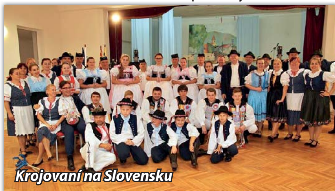
Krojování na Slovensku

Účast na plese nám přislíbila a přijela zatančit Moravskou besedu chasa z Násedlovic a ze Šardic. Místní mužský pěvecký sbor zahájil ples moravskou hymnou „Moravo, Moravo“ a také vyplňoval svými písněmi místa na plese, kdy dechová hudba nehrala. O kulturní vystoupení se také postaral soubor Ripin z naší družební obce Velké Ripňany ze Slovenska, kteří také přijeli ve