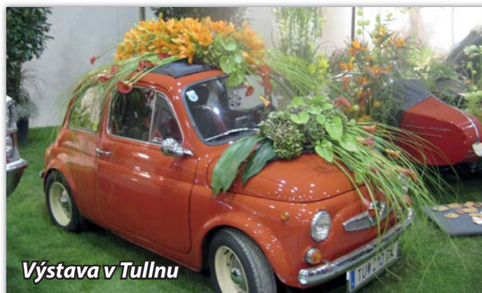
Výstava v Tullnu