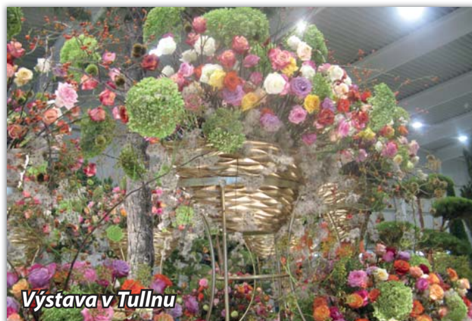
Výstava v Tullnu