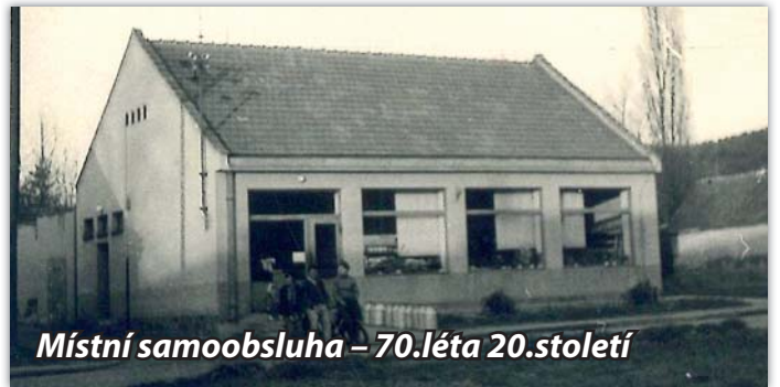
Místní samoobsluha – 70.léta 20.století