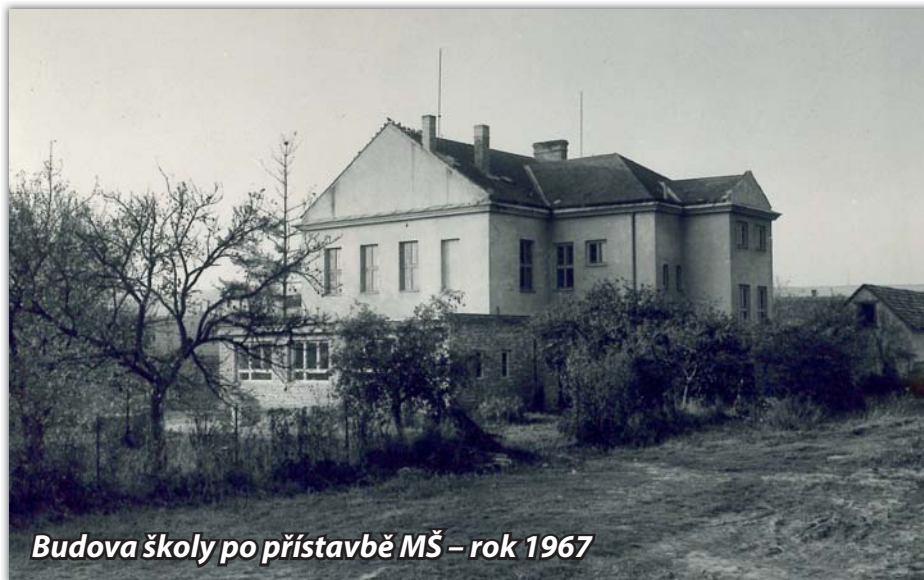
Budova školy po přístavbě MŠ – rok 1967