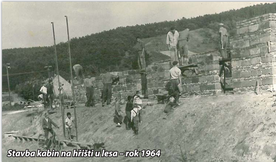
Stavba kabin na hřišti u lesa – rok 1964