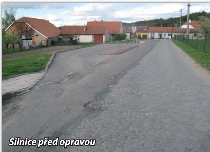
Silnice před opravou