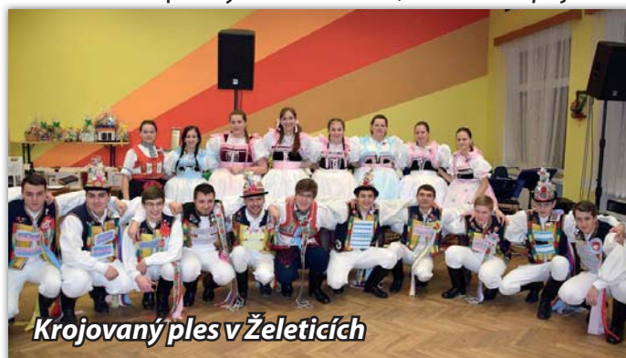
Krojovaný ples v Želeticích