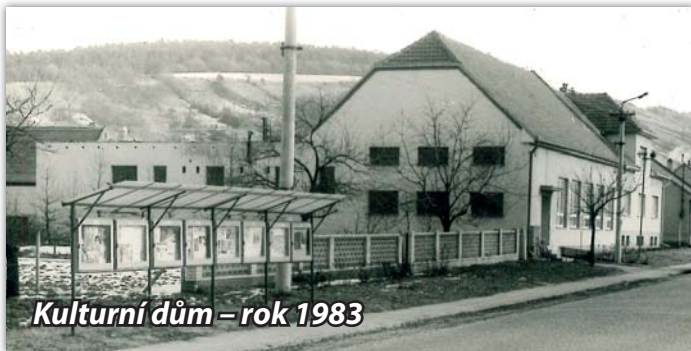
Kulturní dům – rok 1983