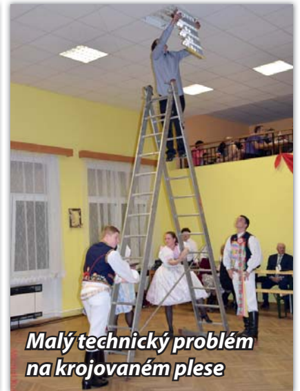
Malý technický problém na krojovaném plese