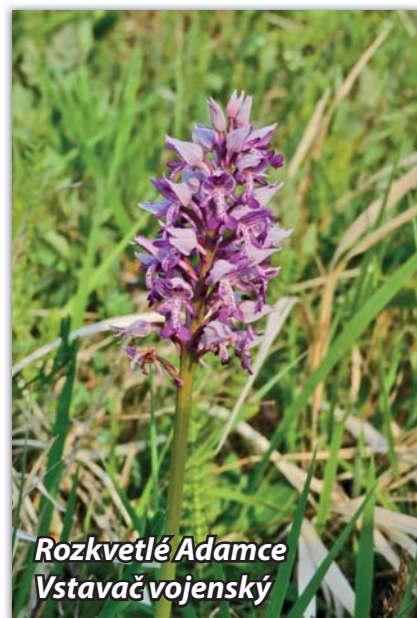
Rozkvetlé Adamce Vstavač vojenský