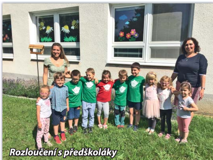
Rozloučení s předškoláky