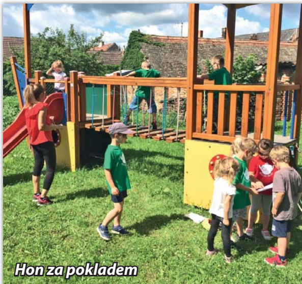
Hon za pokladem