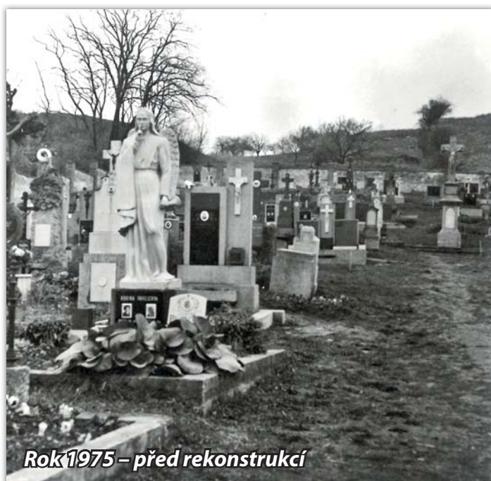
Rok 1975 – před rekonstrukcí