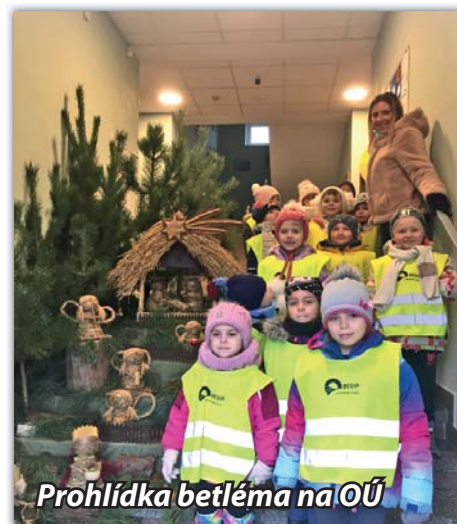
Prohlídka betléma na OÚ