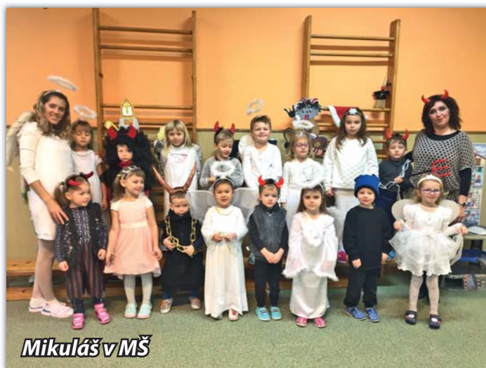
Mikuláš v MŠ