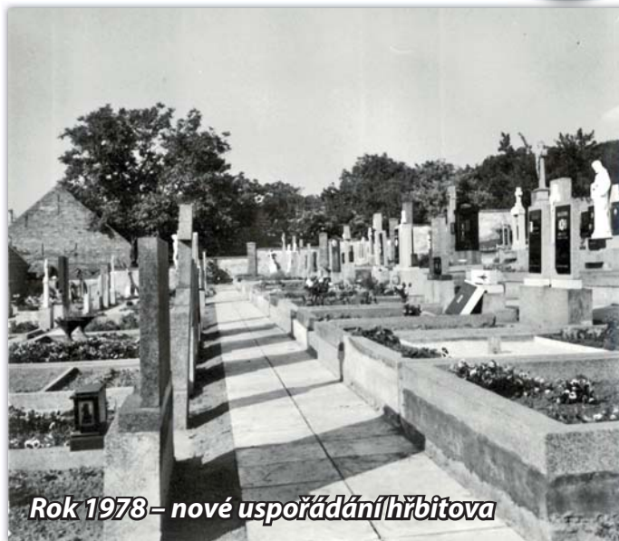
Rok 1978 – nové uspořádání hřbitova