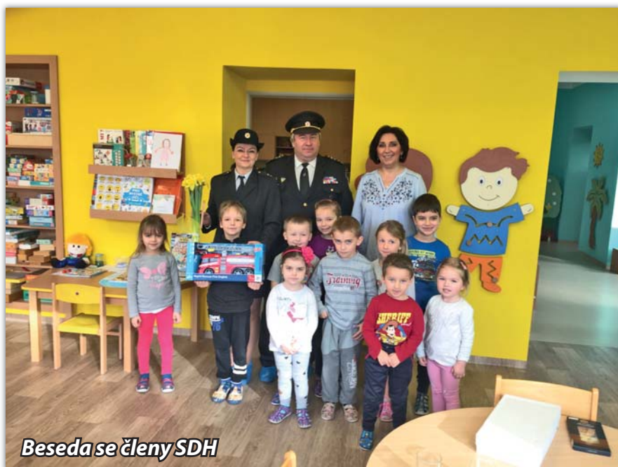
Beseda se členy SDH

ná hygienická opatření je nutno stále dodržovat. Těší nás alespoň navýšený počet dětí od března na 18. Situace nás přiměla k přeorganizování akcí s rodiči tak, že i když se nemůžeme společně setkávat v MŠ, zapojujeme je a jejich děti k vlastním tvorbám z domova, konečný výrobek přináší k vyzdobení naší školky (např. Výstava květin a plodů našich zahrádek nebo akce Zimní chvilka kreativity a čekají nás do konce roku ještě další). Z kulturního života jsme shlédli dvě divadelní vystoupení, Kouzelnické vystoupení Duo Waldini a proběhlo Vánoční fotografová-