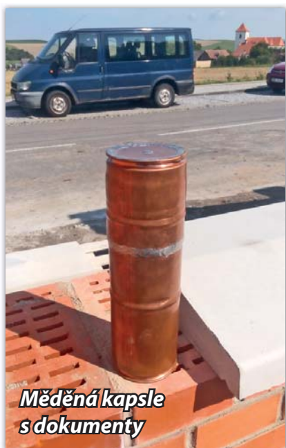
Měděná kapsle s dokumenty