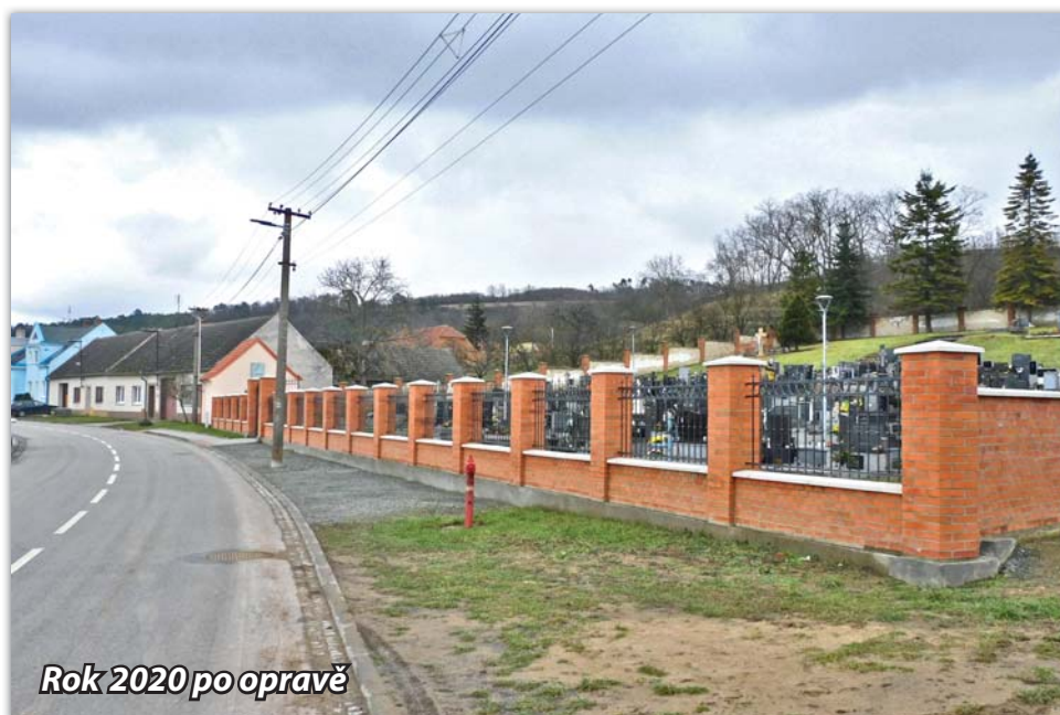
Rok 2020 po opravě