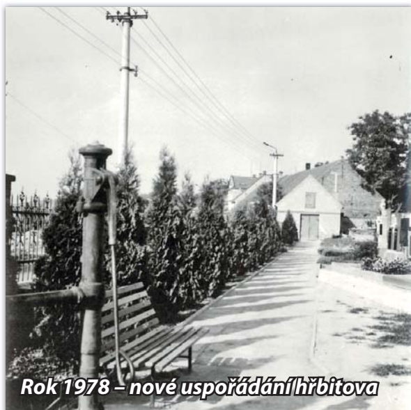
Rok 1978 – nové uspořádání hřbitova