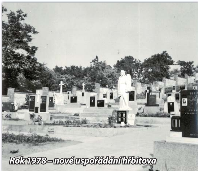
Rok 1978 – nové uspořádání hřbitova