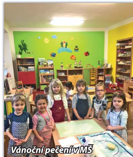
Vánoční pečení v MŠ