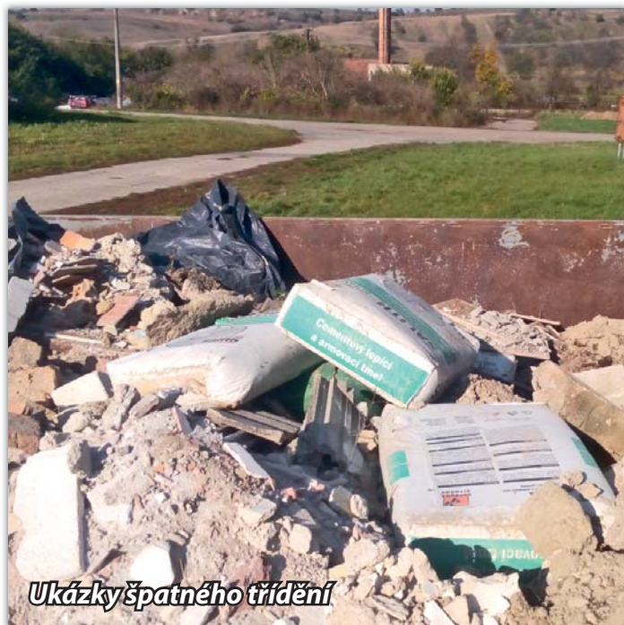
Ukázky špatného třídění