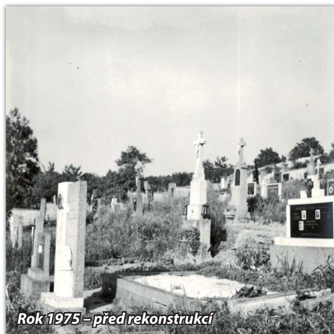
Rok 1975 – před rekonstrukcí