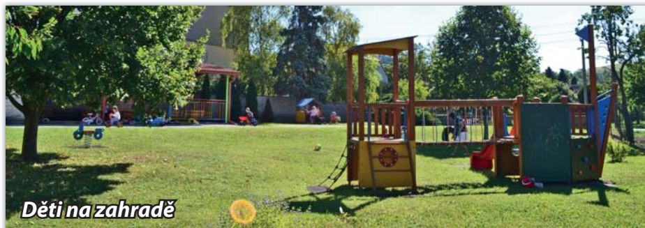
Děti na zahradě