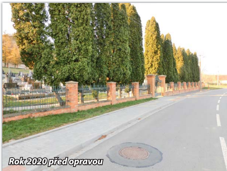
Rok 2020 před opravou