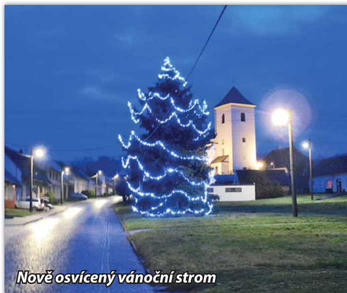
Nově osvětlený vánoční strom