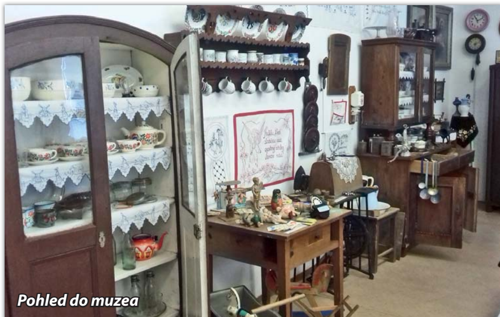
Pohled do muzea