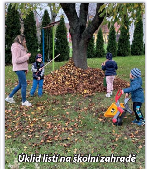
Úklid listí na školní zahradě