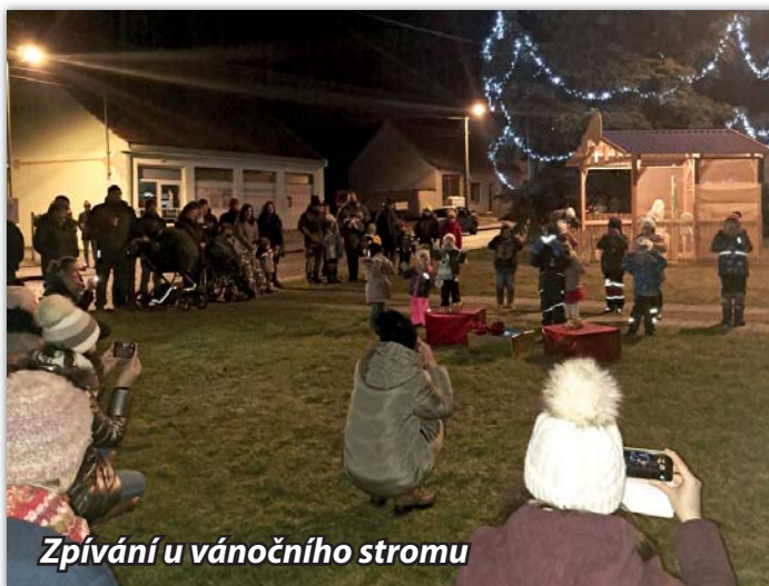
Zpívání u vánočního stromu