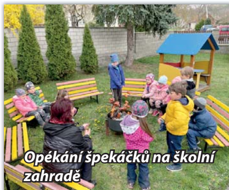
Opékání špekáčků na školní zahradě