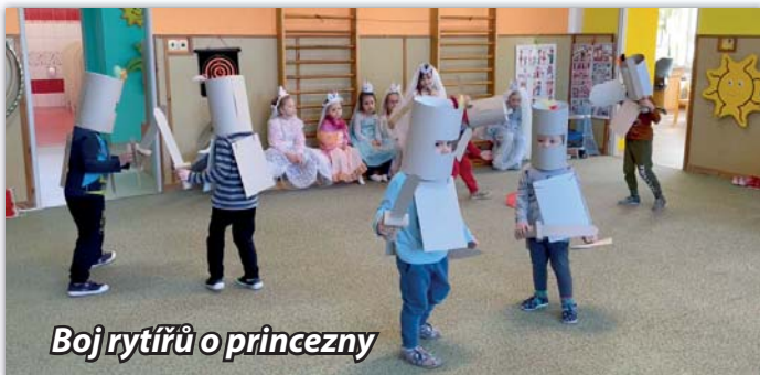
Boj rytířů o princezny