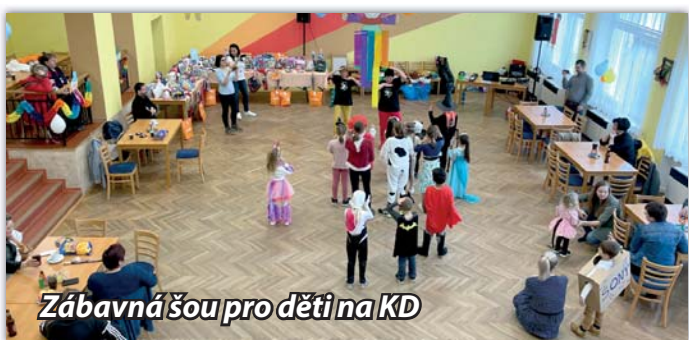
Zábavná šou pro děti na KD