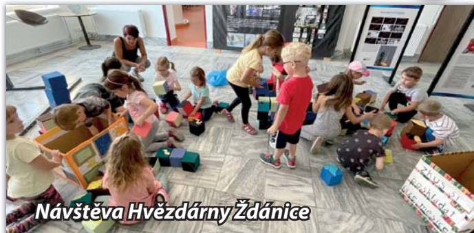
Návštěva Hvězdárny Žďánice