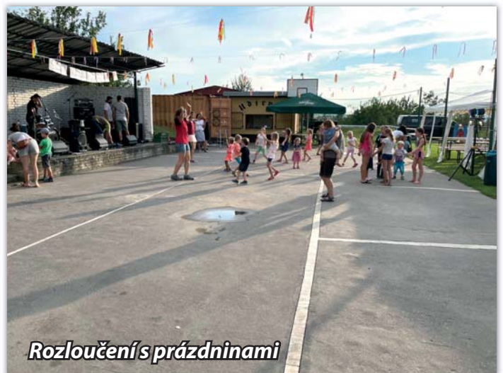
Rozloučení s prázdninami