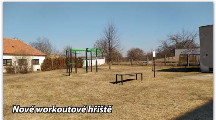
Nové workoutové hřiště