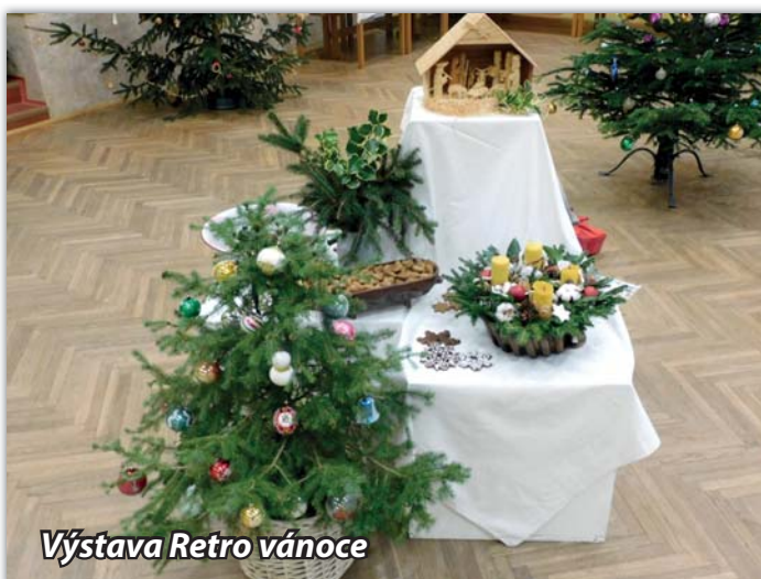
Výstava Retro vánoce