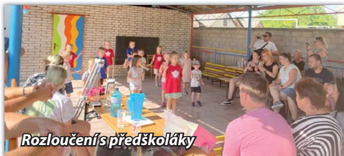
Rozloučení s předškoláky