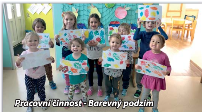
Pracovní činnost - Barevný podzim