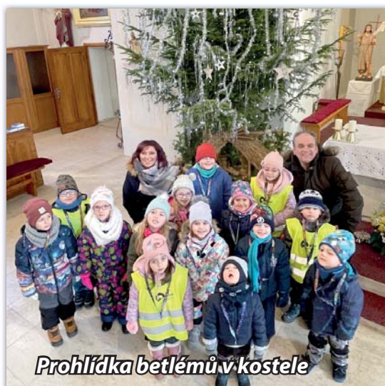
Prohlídka betlémů v kostele