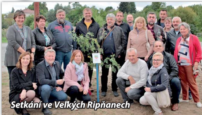
Setkání ve Velkých Ripňanech