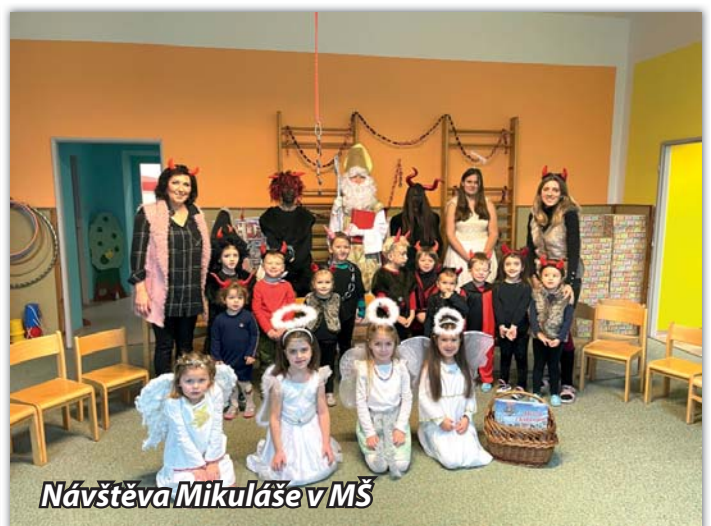
Návštěva Mikuláše v MŠ