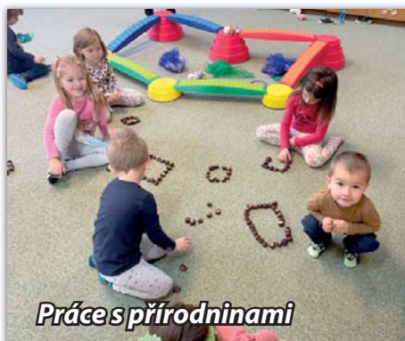
Práce s přírodninami